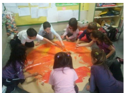
Para educar a un niño hace falta la tribu entera.

Pretendemos que nuestra escuela sea una escuela de todas y para todas las personas. Por esta razón creemos que la participación de toda la comunidad educativa es fundamental para alcanzar el difícil reto al que nos enfrentamos cada día: conseguir una escuela democrática, crítica, abierta al mundo, científica, literaria, solidaria y justa.